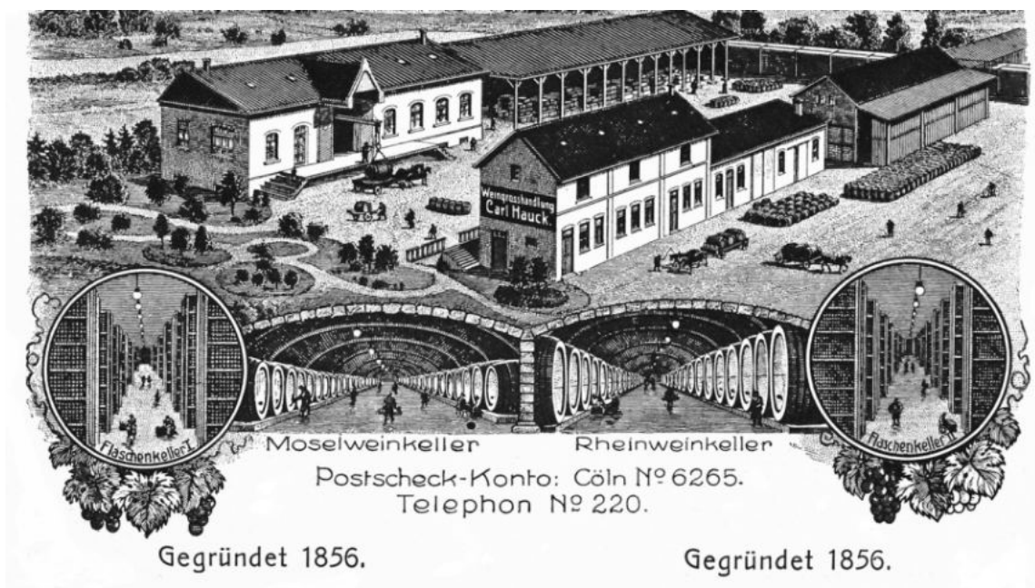
Abbildung: Alte Postkarte der Weingroßhandlung Carl Hauck in Saarbrücken. (NI KW 1320, Stadtarchiv Saarbrücken)

Bitte melden Sie sich per E-Mail an stadtarchiv@saarbruecken.de oder telefonisch unter Tel. +49 681 905-1258 an.