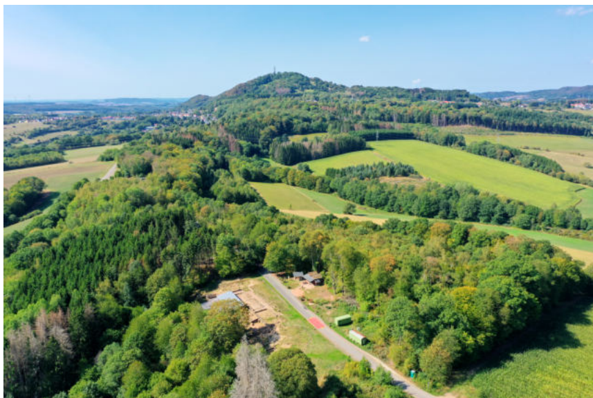
Luftbild archäologische Ausgrabungsstätte im Wareswald bei Tholey (2020)

Örtlichkeit: Vicus Wareswald (Zufahrt an der L 135 zwischen Theley und Tholey) 66636 Tholey