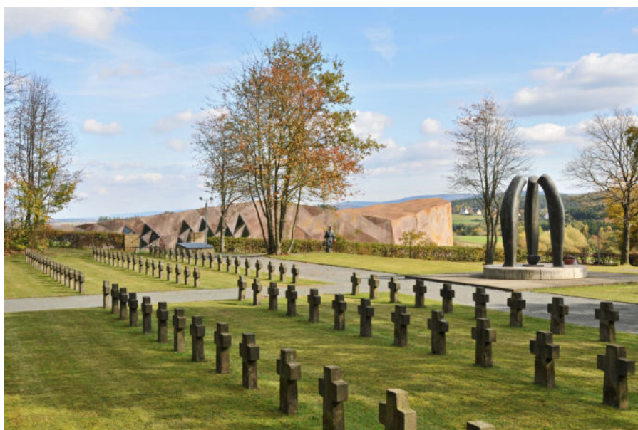
Gedenkstätte SS-Sonderlager/KZ Hinzert (im Hintergrund das Dokumentations- und Begegnungshaus, 2008)

Örtlichkeit: Gedenkstätte SS-Sonderlager/KZ Hinzert – Landeszentrale für politische Bildung An der Gedenkstätte 54421 Hinzert-Pöler