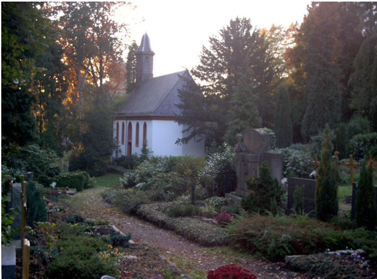
Alter Friedhof und Kapelle in St. Ingbert (2004)

Örtlichkeit: Alter Friedhof – Treffpunkt Kapelle Am Alten Friedhof 66386 St. Ingbert