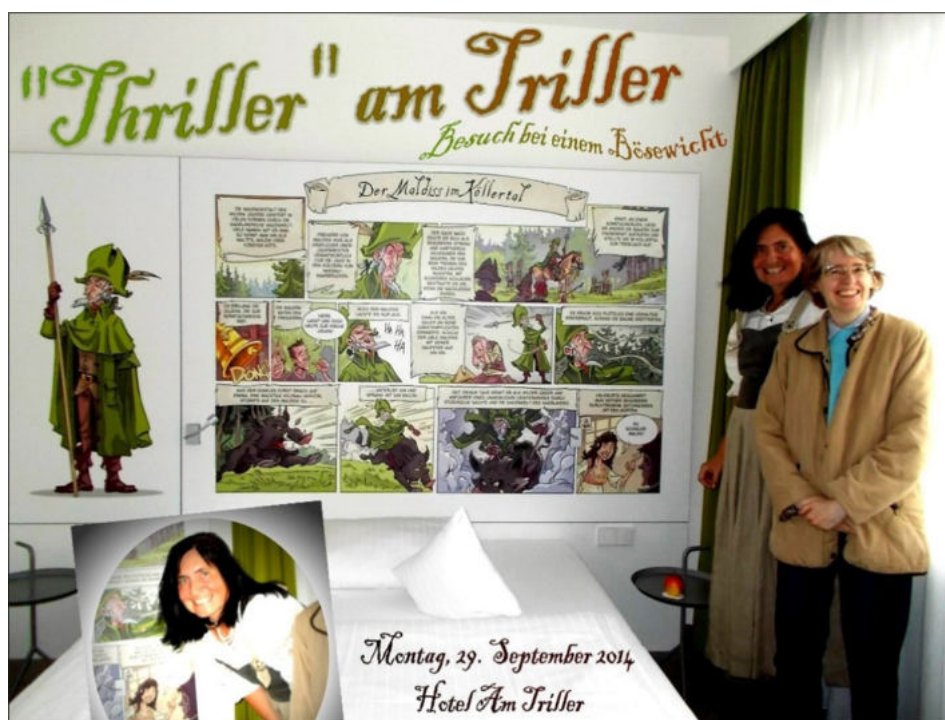
Abbildung/©: Collage von Petra Scheller

Bericht: Günter Groß, Leiter des VLS-Referats „Mundart“